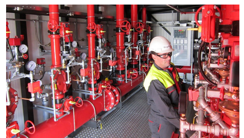
Service & Onderhoud